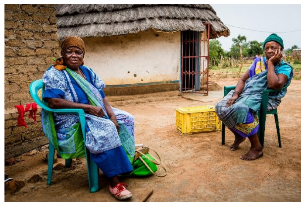
Bild: Kundinnen von SEF

Darüber hinaus bietet SEF neben Krediten auch Sparprodukte sowie Trainings in Finanzangelegenheiten und Gleichberechtigung an. Dies ist ein wesentliches Element, um die 56 Prozent der Bevölkerung zu unterstützen, die unterhalb der nationalen Armutsgrenze liegen.