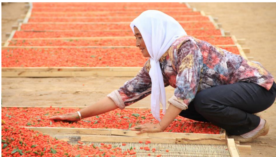
Kundin von Huimin beim Trocknen von Beeren

Das Mikrofinanzinstitut Huimin (Ningxia Dongfang Huimin Microfinance Ltd.) ist in ländlichen Bereich in Zentralchina engagiert und richtet sich dort vorrangig auf Mikro-Unternehmerinnen aus, mehr als 80% des Kundenbestands sind Frauen. Das durchschnittliche Einkommen liegt um Faktor 3 bis 4 unterhalb der reicheren Landesteile, die Bevölkerungsstruktur ist vergleichsweise heterogen und auf Landwirtschaft ausgerichtet. Das Institut hat ein klares Mandat für finanzielle Inklusion und bedient daher auch Kund*innen, an denen rein kommerzielle Kreditgeber kaum Interesse zeigen.