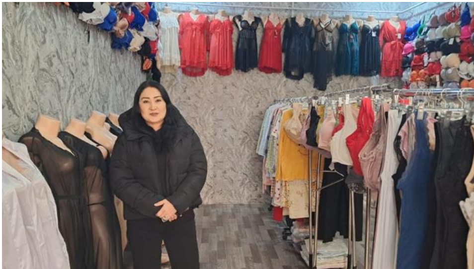
Kundin von Ehtirom mit ihrem Geschäft

Ehtirom Plus Mikromoliya Tashkiloti LLC wurde 2007 gegründet und ist das erste lizenzierte Mikrofinanzinstitut in Uzbekistan. Es verfügt daher über eine entsprechende Geschäftserfahrungen sowie langjährige Kundenbeziehungen in der Mikrofinanz. Der Fokus des Instituts liegt auf der Bereitstellung von Finanzdienstleistungen, welche eine nachhaltige wirtschaftliche Entwicklung unterstützen sowie die Lebensqualität der Kund*innen verbessern. Die Zielgruppen sind dabei v.a. Kund*innen in kleinen Städten sowie ländlichen Regionen. Der GLS AI-Mikrofinanzfonds hat erstmalig im April 2025 einen Kredit über 750.000 US-Dollar an Ehtirom ausgereicht.