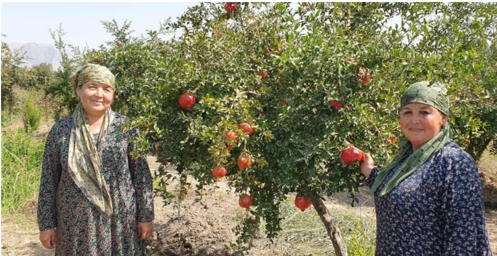
Foto: Kundinnen von Bailyk

MCC Bailyk Finance LLC ("Bailyk") ist ein Mikrofinanzinstitut aus Kirgistan. In dem gebirgigen Land mit wenigen Ballungsräumen fokussiert sich Bailyk auf ländliche und dörfliche Regionen beim Ausbau des eigenen Filialnetzes. In diesen unterversorgten Gebieten werden bezahlbare Kredit- und Finanzdienstleistungen angeboten, u.a. über neue und digitale Kanäle, um die Lebensqualität der Kund*innen zu verbessern.