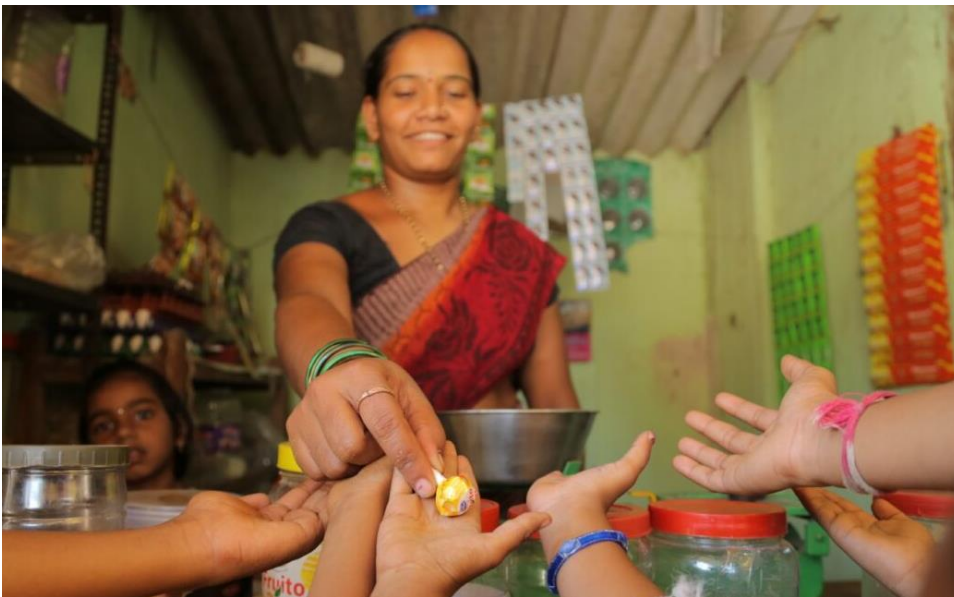
Foto: Kundin von Svatantra in ihrem Ladengeschäft

Svatantra Microfin Private Limited ist ein indisches Mikrofinanzinstitut und bereits seit 2019 Kunde des GLS AI - Mikrofinanzfonds. Das Institut bedient ausschließlich Kundinnen und bietet eine Vielzahl an passenden Finanzlösungen und zusätzlich auch Weiterbildungen an. Ein weiterer Schwerpunkt liegt in der permanenten Verbesserung der Effizienz und dem Einsatz von technischen Innovationen, um speziell jene Kundinnen zu erreichen, welche keinen Zugang zum traditionellen Bankensystem haben.