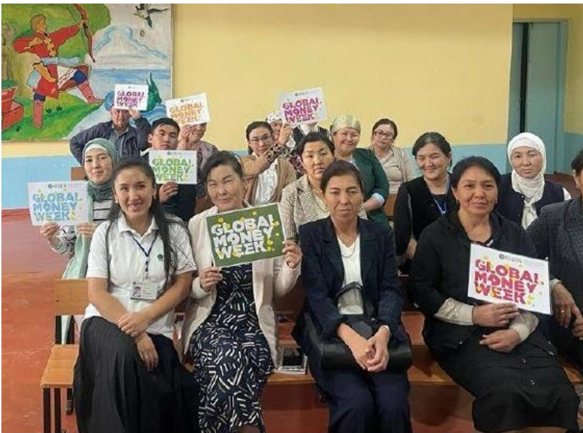
Foto: Kundinnen von Oxus bei einer Weiterbildung

Das Institut wurde 2006 gegründet und verfügt seit Sommer 2020 über eine Mikrofinanz-Lizenz der Zentralbank Kirgistans. Das Unternehmensziel ist die Förderung von finanzieller Inklusion sowie die Unterstützung einer nachhaltigen Entwicklung insbesondere in ländlichen Regionen – hier werden rund 60% des Kreditportfolios ausgereicht. Der Anteil an weiblichen Endkund*innen liegt mittlerweile bei über 50%. Unter den Mitarbeitenden des Instituts liegt der Anteil an weiblichen Kolleg*innen zuletzt bei rund 65%.