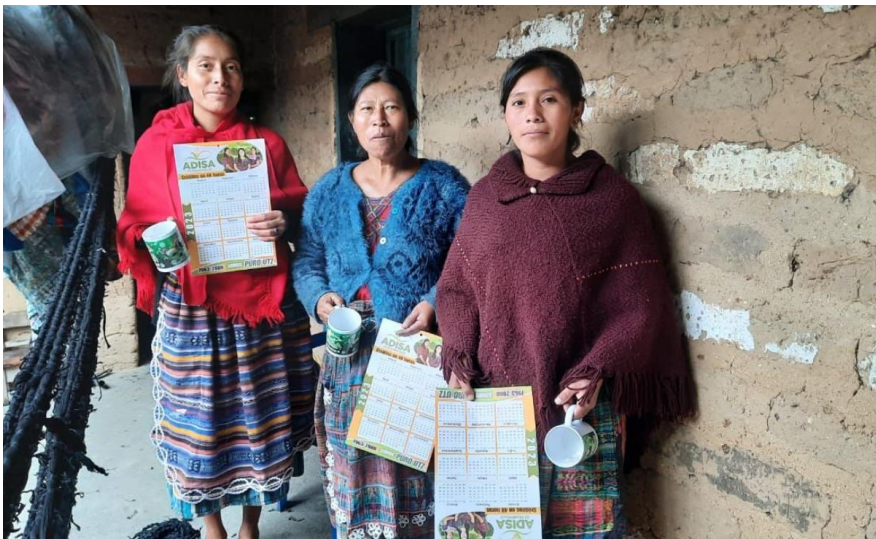
Foto: Kundinnen von ADISA

Die Asociación para el Desarrollo Integral de San Antonio Ilotenango (ADISA) wurde 1991 gegründet, um die wirtschaftliche Entwicklung in der Region El Quiché im Südwesten von Guatemala zu fördern. Das Mikrofinanzinstitut bietet seinen Kund*innen ein auf deren Bedürfnisse angepasstes Angebot an Finanz- und Beratungsdienstleistungen an. 79% des Kreditportfolios wird an Frauen ausgereicht, der Schwerpunkt der Tätigkeit liegt in ländlichen Regionen.