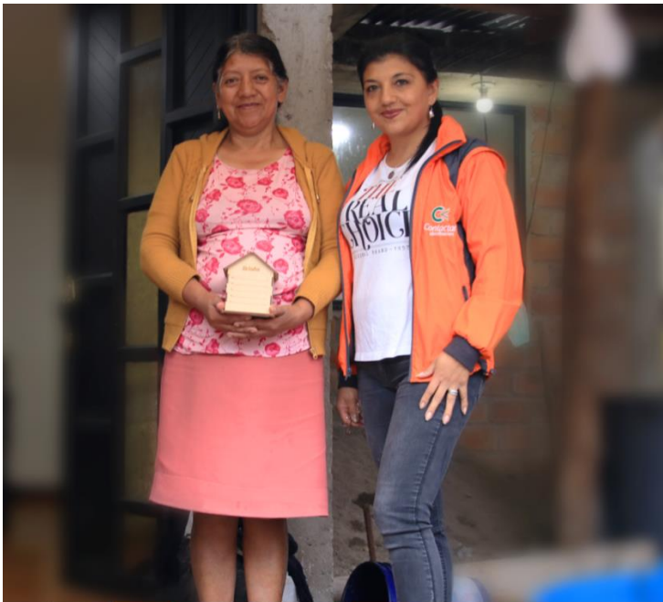
Kundin und Mitarbeiterin von Contactar

Contactar ist ein erfahrenes Mikrofinanzinstitut mit guter Unternehmensführung und ist bereits seit über 30 Jahren im kolumbianischen Markt tätig. Das Mikrofinanzinstitut arbeitet vorrangig mit Mikro-Unternehmer*innen in ländlichen Gebieten zusammen. Weiterhin unterstützt Contactar kleine Geschäfte durch ihren regionalen Ansatz sowie Landwirtschaftsmessen oder auch unterschiedliche Fortbildungen für seine Kund*innen.