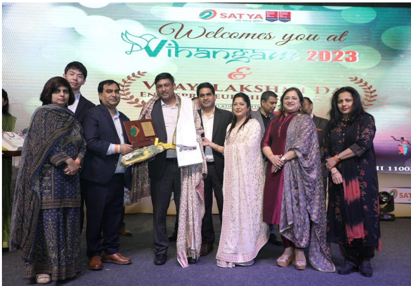
Mitarbeiter*innen von Satya bei der Unternehmerkonferenz Vijayalakshmi

Satya MicroCapital Ltd ist ein registriertes Mikrofinanzinstitut mit Sitz in Dehli, welches erschwingliche Mikrodarlehen vorrangig an Frauen in ländlichen Bereichen in Indien vergibt.