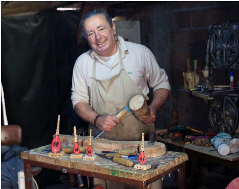
Kunde von AFK Kosovo

Agjencioni per Financim ne Kosove (AFK Kosovo) ist ein sozial verantwortungsbewusstes Mikrofinanzinstitut mit erfahrenen Mitarbeiter*innen und einer sehr guten Kreditqualität. Es ist das viertgrößte Mikrofinanzinstitut im Kosovo, verfügt landesweit über 28 Filialen und ist sehr aktiv bei der Unterstützung und Finanzierung von Unternehmungen in der Landwirtschaft.