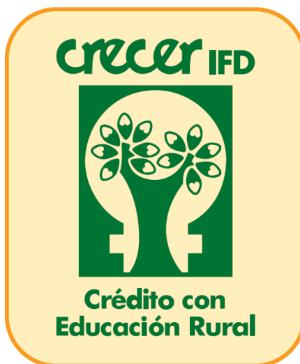
Logo von Crecer

Am 29. März 2023 haben FS Impact Finance als Fondsmanager und IPConcept als Fondsverwalter des GLS AI - Mikrofinanzfonds hohe Handlungsbereitschaft gezeigt und innerhalb von weniger als 72 Stunden die notwendigen administrativen Vorkehrungen getroffen, um auf Seiten des bolivianischen Partnerinstituts CRECER erhöhte Kosten von rund 50.000 USD zu vermeiden. Die Währungsreserven in Bolivien gehen aktuell stark zurück, weshalb die Notenbank sehr kurzfristig Regelungen eingeführt hat, um sämtliche US-Dollar Zahlungen an das Ausland mit zusätzlichen Gebühren zu belegen, und so die Abflüsse von Hartwährung zu begrenzen.