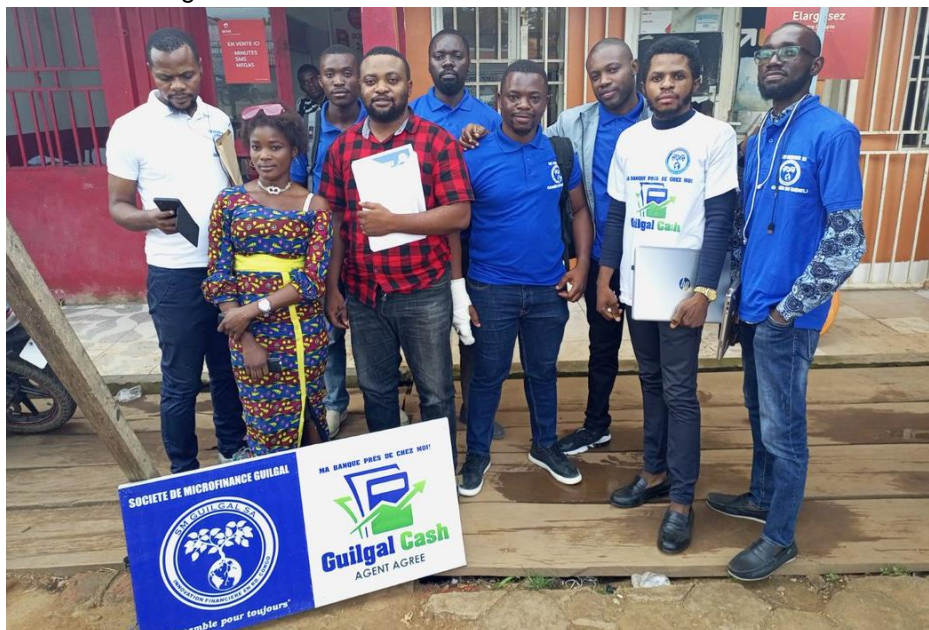
Mitarbeiter*innen der Société de Microfinance Guilgal