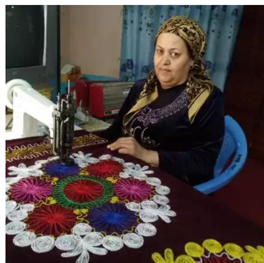
Bild: Kundin von IMON

CJSC MDO "IMON INTERNATIONAL" ist seit 2020 Kunde des GLS AI Mikrofinanzfonds. Das MFI ist zwar nicht ausschließlich auf Kundinnen ausgerichtet, jedoch sind Frauen als Zielgruppe ein elementarer Bestandteil der sozialen Mission, was u.a. in der Unterstützung für ein nationales Unternehmerinnen-Netzwerk und in der Preisverleihung an erfolgreiche Unternehmerinnen zum Ausdruck kommt. Das MFI hat insgesamt über 100.000 Kund*innen und ist in 28 Regionen in Tadjikistan vertreten.