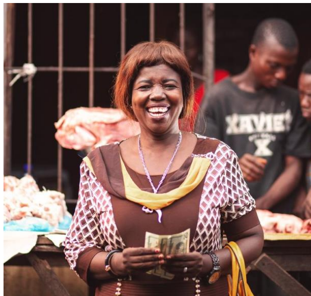
Bild: Mitarbeiterin von Baobab DRC