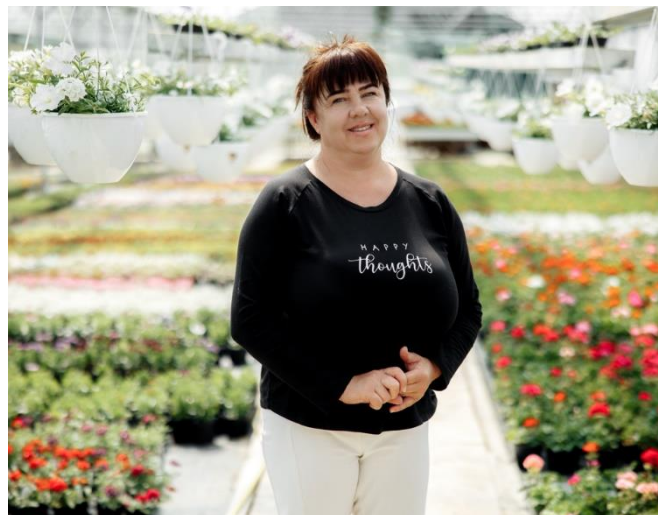
Bild: Kundin von Microinvest

Microinvest SRL ist das größte MFI in Moldawien und seit 2017 ein Partnerinstitut des GLS AI - Mikrofinanzfonds. Trotz der negativen Auswirkungen der Pandemie sowie den Einschränkungen, welche sich aus dem Krieg in der benachbarten Ukraine ergeben, blieben die Geschäftszahlen solide. Die Qualität des Kreditportfolios hatte sich zuletzt sogar leicht verbessert. Dennoch rechnet das Management hier wieder mit einer Eintrübung und hat entsprechende finanzielle Vorsorge getroffen.